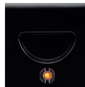
Световой индикатор работы. Ручка для переноски.