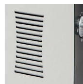
Принудительное движение воздуха TLS-603 T.