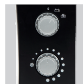
Ручка управления и термостат.

Для увеличения потока воздуха через конвектор, модель TLS-603 T укомплектована встроенным вентилятором на передней панели.